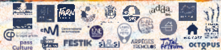
illustration : Alca (Léo Alcaraz)